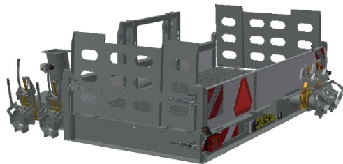
HECKRAHMEN FÜR QUAD UND WASSERPUMPE