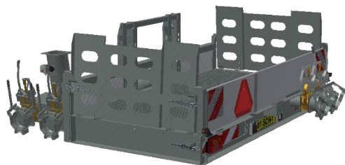
ACHTERFRAME MET AANZUIGING