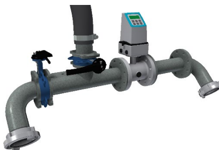
WATERAANSLUITING INCL. METER