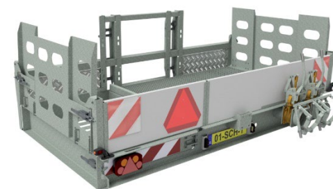
ACHTERFRAME VOOR QUAD + WATERPOMP