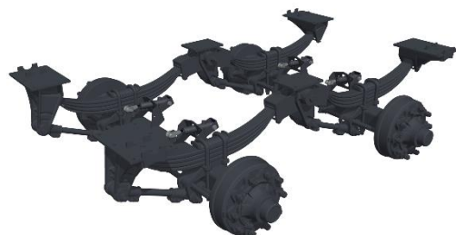
24 TON PARABOL GEFEDERTES TANDEM